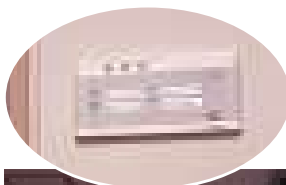
(左円) 病室アダプター (VH-R 680T/4) (左下) PHSでチームナーシング!! (右下) 病室のハンド子機 (VH-R 560C)

この他、3階の救命救急センターや1階の隔離病棟にもナースコールシステムが設置されており、常に患者さんに“安心と信頼”を提供できる院内コミュニケーションツールとして活用されています。