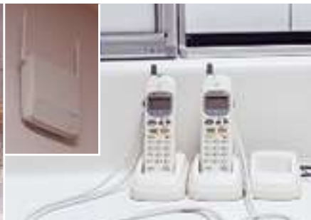
▲PHS接続装置とコードレス電話機