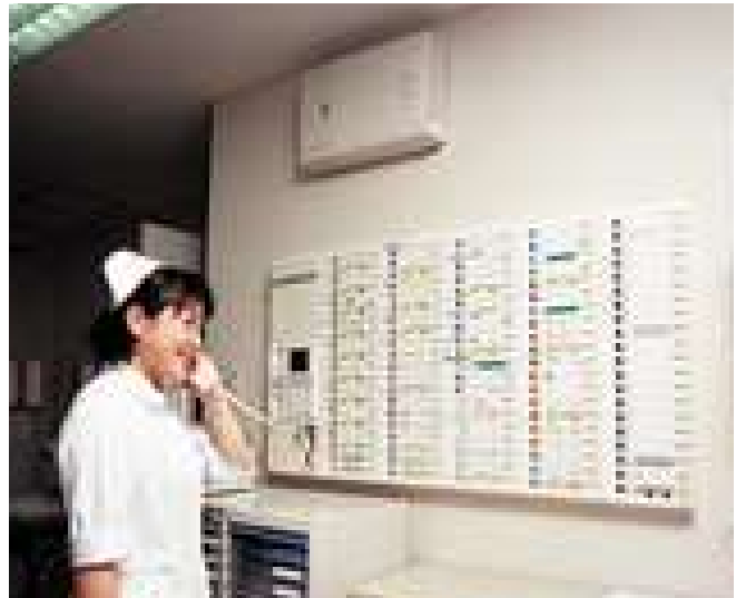
▲ナースセンターの親機(100局)と中央制御装置