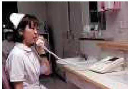
▲サブセンターのナースコール通話機